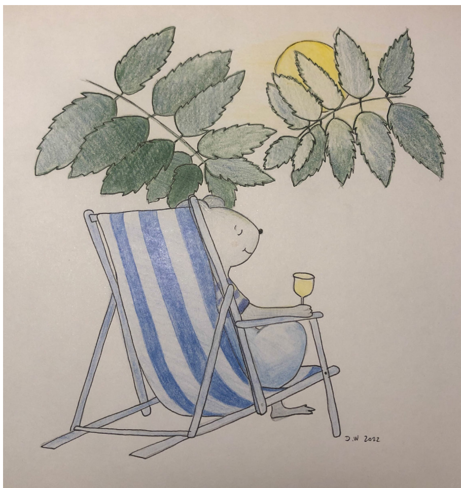
Illustration : Daphné Widmer