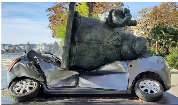
Pour une fois, c'est une voiture qui s'est fait écraser par un chat.

Votre réponse est attendue au bureau communal ou par mail à l'adresse : commune@sorens.ch