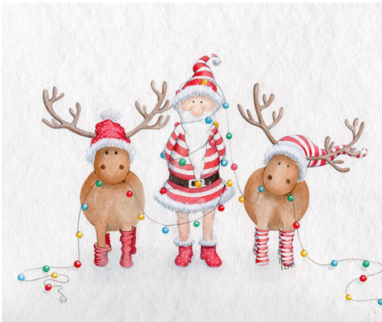
Illustration : Marie-Prune Bonzon