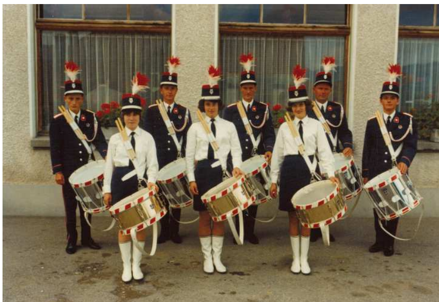
Inauguration des uniformes, 29 septembre 1968

Après Bulle en 1965, la fanfare participe encore aux fêtes cantonales de Guin en 1970, de Romont en 1975. En 1985, à la Fête cantonale à Morat, elle se présente avec un effectif de 52 membres, dont 14 tambours, en formation de batterie anglaise.