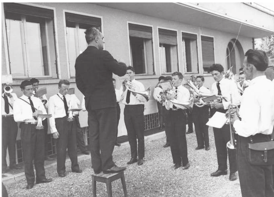
Aubade au Foyer St-Joseph, 28 avril 1963 - ©Photo Glasson

Le 29 septembre 1968, jour de la Patronale, grâce une nouvelle fois à l'appui de la population, les 41 musiciens sorenois purent enfin substituer à la fameuse chemise blanche et cravate noire un uniforme de fort belle allure, qui sera fièrement porté durant 20 ans. Le matin, la population fut réveillée par une diane bien sonnante, puis les musiciens allèrent donner aubade à la marraine et au parrain de leur drapeau, avant de déguster une soupe à l'oignon. Au début de la matinée ils défilèrent à deux reprises. Ils firent une dernière fois honneur à leur ancienne tenue, puis ils paradèrent dans leurs uniformes. Après l'office présidé par M. le Curé Maudonnet, le concert sur la place du village, le banquet officiel, auquel étaient invités une brochette de personnalités de la région, fut servi à l'Hôtel de l'Union.